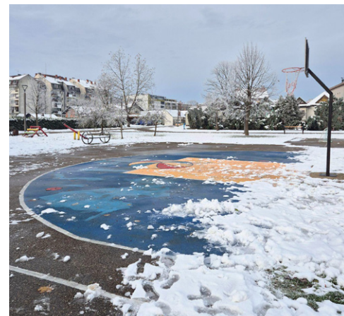
Basketbalové hřiště ve městě Gradiška

Tato výměna jim poskytla cennou inspiraci pro další aktivity v Arménii a významný vzdělávací i osobní zážitek.