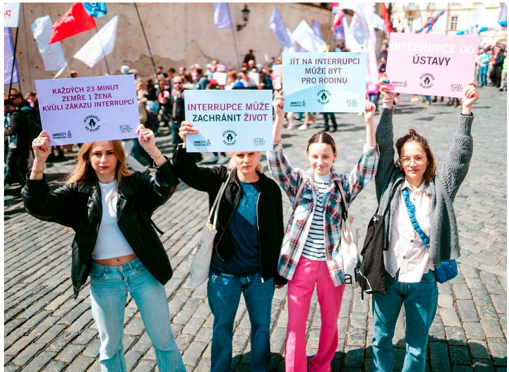
Amnesty International během pochodu Hnutí pro život

Na konci dubna jsme během pochodu Hnutí pro život v Praze hesly a transparenty připomněli, že interrupce je lidské právo. A prostřednictvím piety s oblečením taky to, že každých 7 minut zemře kvůli zákazu interrupcí ve světě 1 žena. Petici za zakotvení práva na interrupci v české ústavě už podepsaly desítky tisíc lidí. Přidejte se!