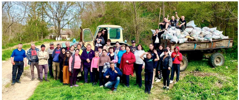
Arnika v Moldavsku.

Arnika také připomněla výročí zničení Kachovské přehrady v Ukrajině, jež se stalo ztělesněním environmentálních dopadů ruské agrese. V Chersonu jsme navštívili konferenci diskutující budoucnost nyní prázdné nádrže. Do debaty přispíváme odhalením toxických látek v sedimentech Kachovky , kdy se ukazuje, že poválečná obnova země bude muset počítat s řešením ekologických zátěží.