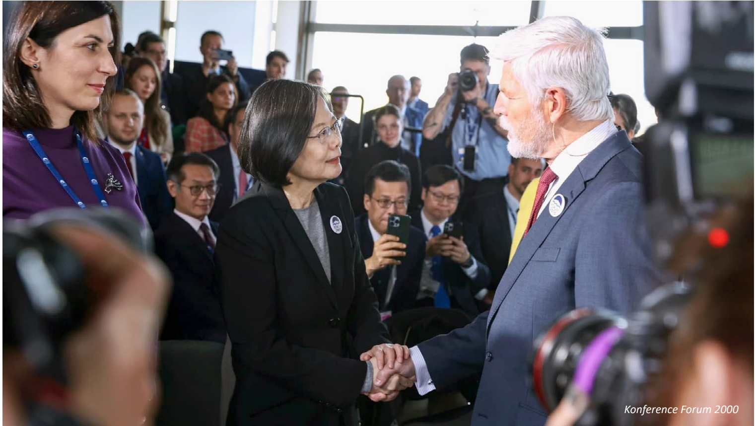
Konference Forum 2000

Významnou součástí zahájení konference bude slavnostní předání Mezinárodní ceny Fora 2000 za odvahu a odpovědnost . Ocenění, které bylo založeno nadací Forum 2000 v roce 2021, vzdává hold mimořádné občanské odvaze a činům, jež upřednostňují odpovědnost vůči širší společnosti, obranu demokracie a podporu lidských práv a občanských svobod před osobními zájmy.