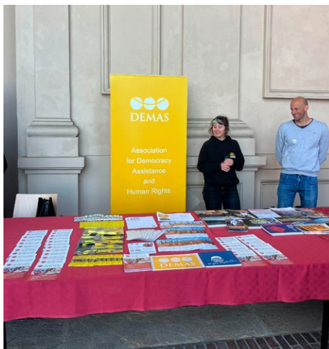
Stánek DEMAS na veřejné části Národních rozvojových dní 23. 5. 2025

První den, Den Afriky , byl věnován odborným debatám a kulatým stolům, které byly letos ve znamení rozvojové spolupráce v Africe, mezi níž spadá například vzdělávání, vědecká a technická spolupráce, ochrana přírodního a kulturního dědictví či podpora občanské společnosti. Druhý