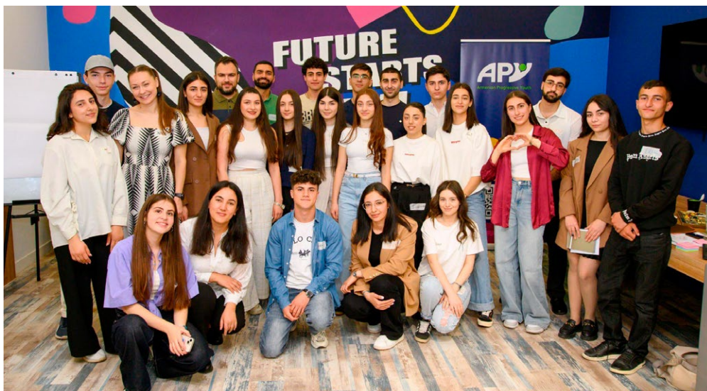
Akademie aktivního občanství v Arménii

Během prvního květnového workshopu jsme se zaměřili na to, co vlastně znamená být aktivním občanem. Druhý workshop se věnoval digitálnímu aktivismu, kde se mládež učila, jak efektivně