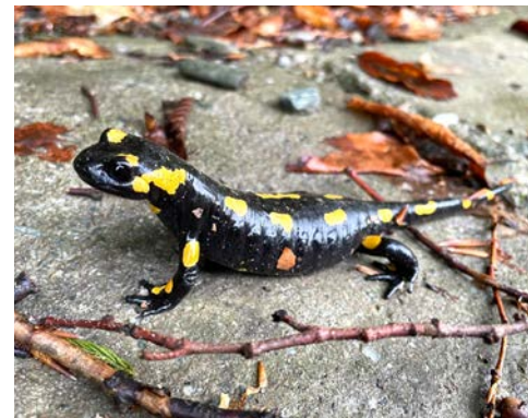
Snímek mloka z bio. průzkumů

Věnujeme se také odhalování toxických látek ve spotřebním zboží doma i v zahraničí. V Srbsku jsme s místní organizací AlHem publikovali studii upozorňující na hladiny nebezpečných ftalátů násobně překračující evropské i místní normy například v dětských pláštěnkách.