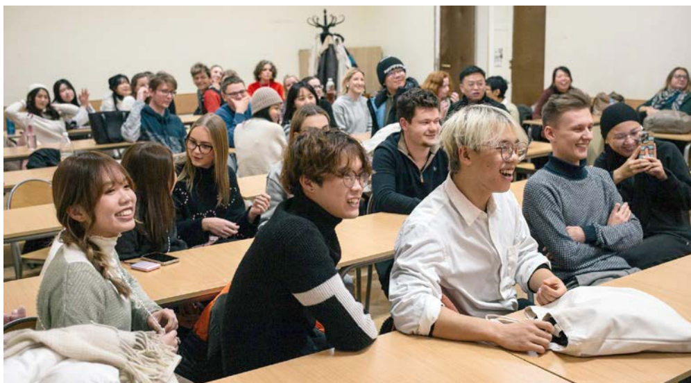
Student visit from CUHK

Innovation in Senior Education: Barcamp 2025! Under the auspices of Transitions and MEMO 98, with support from Google, a two-day digital education marathon took place in Bratislava. The event combined panel discussions, group work, and workshops focused on the practical use of artificial intelligence - from basic orientation to advanced fact-checking techniques. Rich report by our Slovak partner MEMO98. You might recall that we co-organized the fifth annual Barcamp, titled „AI First-Hand Experience,“ in Prague last October. The highlight of this two-day event was the creation of the first Senior AI Expert Group in the Czech Republic, a collaboration between Transitions, Elpida, and Google. We're excited to share that our team has put together a great video from the event!