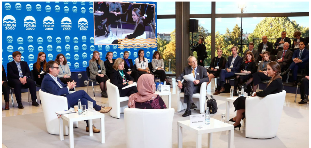
Debaty Café Evropa – Prague Pride