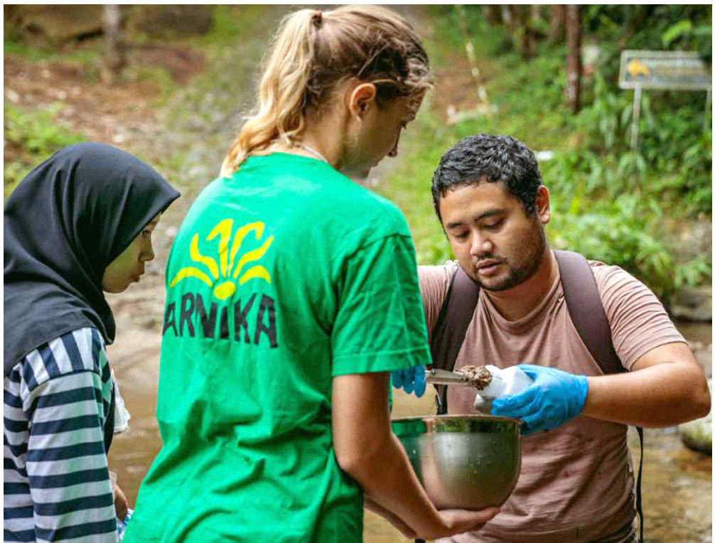
Fotografie ze vzorkování pro indonéskou studii

Pokračujeme i v další odborné práci. Publikovali jsme rozšířenou verzi studie o dopadech spalování odpadů a představili ji v září na webináři, který navštívilo přes 300 lidí z celého světa.