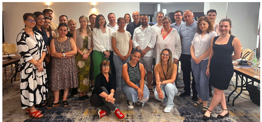
POINT Conference, 24 – 25 th June, Sarajevo

As part of the famed civic tech POINT conference in Sarajevo, we collaborated with SEENPM to host a two-day conference on 24–25 June 2024 exploring tactics to resist hostile foreign influence and disinformation. Thirty-six media professionals, CSO activists, fact-checkers and academics from Bosnia and Herzegovina, Serbia, Montenegro, Albania, Kosovo, North Macedonia, Hungary, Czechia, and the United Kingdom participated.