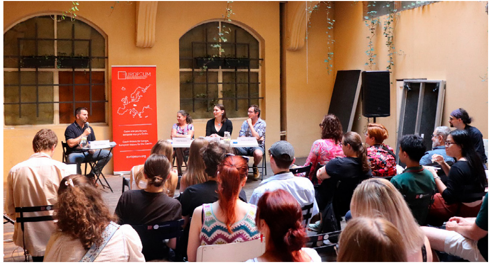
Debaty Café Evropa – Prague Pride

V polovině června jsme také přivítali desítky významných řečníků a propojili osobnosti