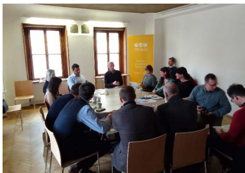
Kulatý stůl k rekonstrukci Ukrajiny: propojení NNO, businessu a státní správy

V rámci projektu Active Citizens Fund byla realizována tři odborná setkání k otázkám souvisejícím s rekonstrukcí Ukrajiny. Dvě se věnovala problematice duševního zdraví a jedno možnostem spolupráce nevládních organizací, businessu a státní správy. Tato aktivita vznikla v reakci na praktické potřeby různých sektorů podílejících se na obnově Ukrajiny.