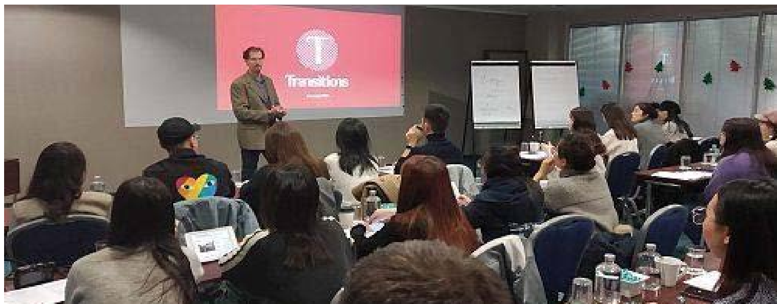
Hong Kong Baptist University – January 2020

For the eleventh year running, Transitions hosted 63 students and five faculty members from the Hong Kong Baptist University (HKBU) during their study abroad visit. The course took