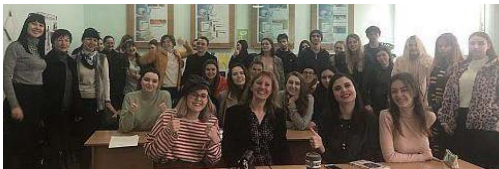
Solutions Journalism – March 2020

Pokračovala série debat EU±, které se během prvního čtvrtletí 2020 věnovaly napří-