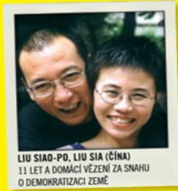
LIU SIAO-PO, LIU SIA (ČÍNA) 11 LET A DOMÁCÍ VĚZENÍ ZA SNAHU O DEMOKRATIZACI ZEMĚ