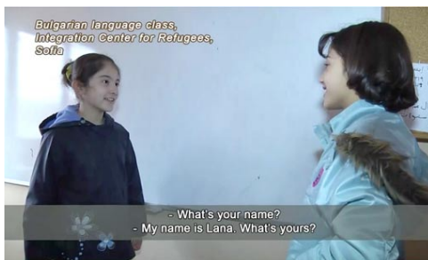
School's Out From Transitions Online 2 weeks ago

In February, we tried something new with the magazine, commissioning broadcast journalist Ivaylo Spasov to produce a short documentary, School's Out , on the plight of children who have fled from Syria to Bulgaria and are left languishing out of school. Of the 2,000 refugee children in Bulgaria, only about 65 attend classes. The video warns of the human capital being squandered and of a looming lost generation of Syrians.