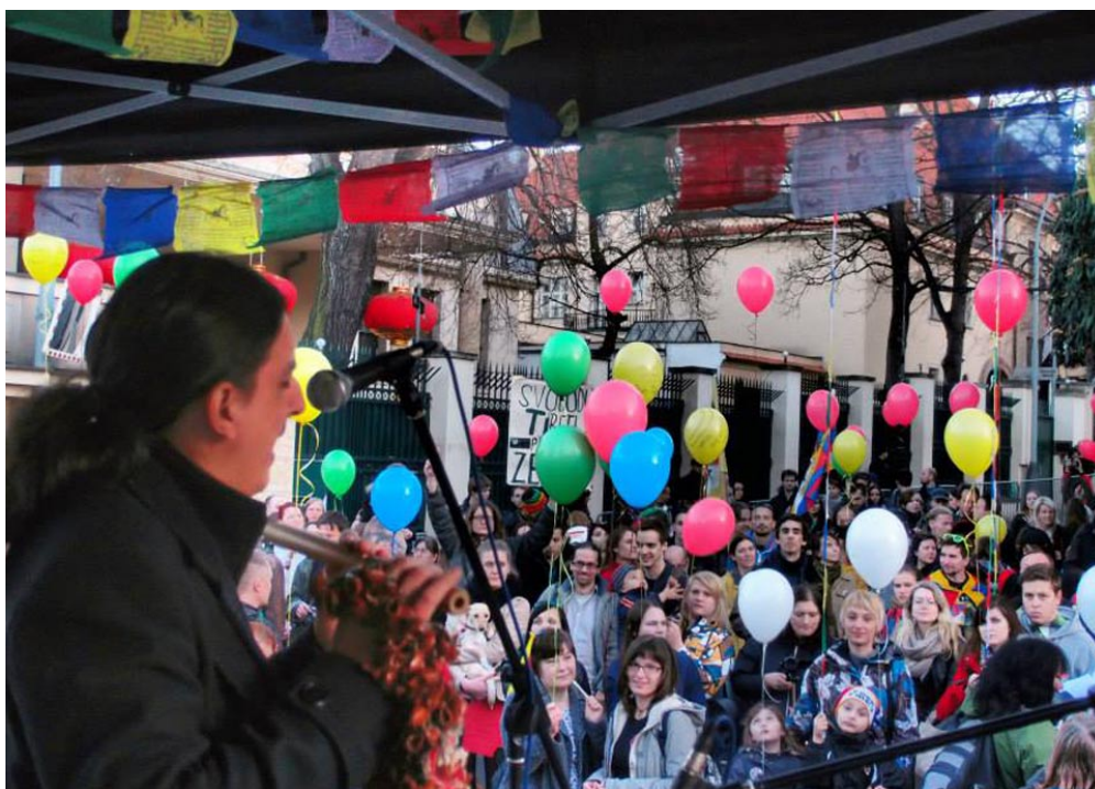
Happening Amnesty International ČR na podporu tibetské kultury před čínskou ambasádou.