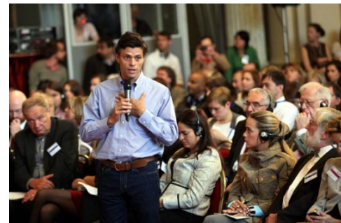
Leopold López vystoupil v září roku 2013 na výroční konferenci Forum 2000 „Společnosti v přerodu“ v Praze.

Mezinárodní poradní výbor Nadace Forum 2000 považuje zatčení Leopolda Lópeze za svévolné, neboť porušuje jeho občanská a politická práva. Jsme pevně přesvědčeni o tom, že tato práva by neměla být pošlapávána.