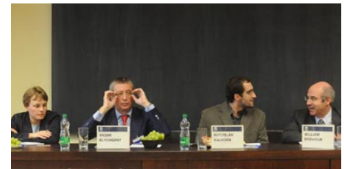
Diskusní panel Doing Business in Russia