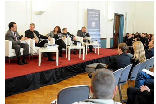
Panelová diskuse s názvem „Ukraine: A Fast Track Away from Democracy?“

V návaznosti na toto stanovisko se během