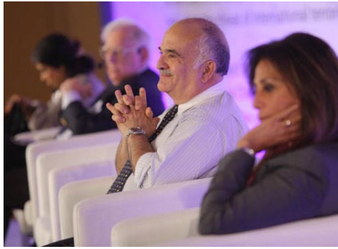
Princ El Hassan bin Talal na panelu o arabském jaru

Nad výzvami současného světa se zamýšlelo mnoho zajímavých osobností, jejich výčet je možné nalézt zde .