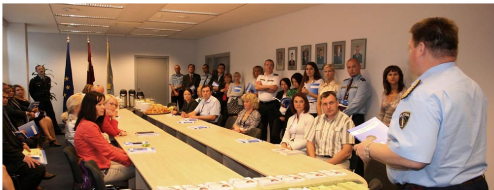
Lotyšský policejní prezident

The project is aimed at remedying anti-Roma stereotyping through the creative use of multimedia in reporting minority issues in new member states of the European Union in Central and Eastern Europe (Bulgaria, the Czech