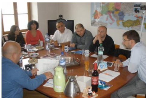
Představitelé gruzínského neziskového sektoru a veřejné správy při přednášce

Studijní návštěva Prahy a Varšavy se zaměřila na sdílení pozitivních i negativních zkušeností třetího sektoru. Mezi diskutovaná témata patřilo například řízení neziskového sektoru, finanční management, finanční nástroje vnější pomoci Evropské unie, transformační politika, video aktivismus, občanská participace a česká zahraniční politika vůči Gruzii. Všechny pražské přednášky byly připraveny platformou DEMAS – jejími členskými organizacemi a Sekretariátem.