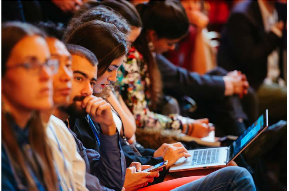
Forum 2000.

Občanské Bělorusko se i v minulých 3 měsících podílelo na rozvoji občanské společnosti v Bělorusku, a to jak formou podpory místních grass-root iniciativ, tak i jednotlivých občanských aktivistů. Občanské Bělorusko jim pomáhá zejména formou vzdělávání, mentoringu, minigrantů a na míru šitých tréninků. I díky tomu tak mohou tyto iniciativy působit a pomáhat v oblastech, jako je boj proti domácímu násilí, obrana lidských práv, pomoc dlouho-