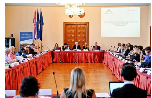
Předseda Nejvyššího soudu Chorvatské republiky Branko Hrvatin zahajuje Mezinárodní soudcovskou konferenci v chorvatském Zadaru.

Ve dnech 18.–19. září 2015 se na zaderské univerzitě uskutečnila mezinárodní soudcovská konference, kterou organizoval CEELI Institut ve spolupráci s Asociací chorvatských soudců. Konference se zúčastnilo 50 soudců převážně ze střední a východní Evropy a Balkánu. Hlavními tématy konference byla problematika hodnocení soudců, etika soudců a efektivita Evropské úmluvy o ochraně lidských práv. Během konference byl také představen dokument Manual on Independence, Impartiality and Integrity of Justice , který byl vypracován skupinou deseti soudců v rámci projektu CEELI In-