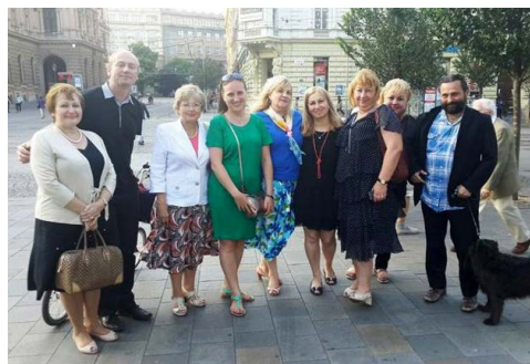
Studijní cesta ukrajinských pedagogů

V rámci našeho ukrajinského projektu zaměřeného na rozvoj alternativního vzdělávání proběhly v Kyjevě semináře věnované multikulturní výchově doplněné o workshopy z dramatické výchovy. Ukrajinci se tak pod ve-