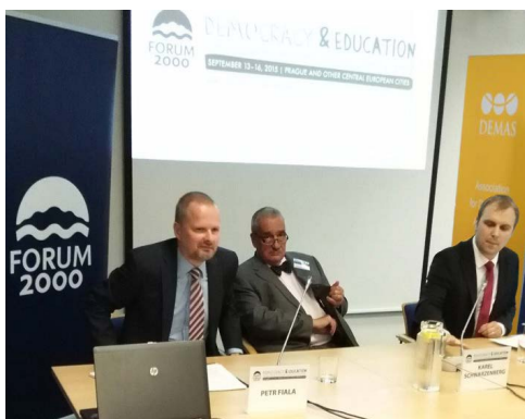
Petr Fiala, Karel Schwarzenberg a moderátor politického panelu Vít Dostál diskutují o evropské transformační politice.

Sekretariát DEMAS spolu se svými členskými organizacemi a Zastoupením Evropské komise v ČR připravil již třetí debatní odpoledne o transformační politice, které se tentokrát konalo u příležitosti 19. výroční konference Fora 2000 v pondělí 14. září odpoledne. První panel,