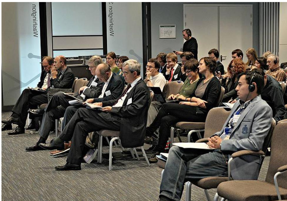
Valná hromada EU-RU CSF v Haagu.

V roce 2013 DEMAS pokračoval v práci pro EU-Russia CSF coby hostitel jeho Sekretariátu a vedoucí projektového konsorcia. Dvouletý projekt, započatý v roce 2012, byl financován z 85 % Evropskou komisí. Bohaté aktivity Fora se soustředily na implementaci konkrétních projektů pracovních skupin , do nichž jsou členové Fora tematicky rozděleni, vydávání společných prohlášení a stanovisek , publikaci policy paperů a dále též na advokační činnosti .