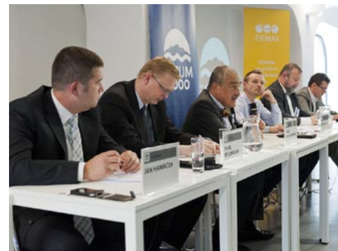
Diskuze DEMAS na Foru 2000, září 2013.

včetně navýšení státní dotace na podporu transformačních projektů. Na stránkách Nadace Forum 2000 je možné nalézt stručný obsah panelu i videozáznam . Další panel, na němž se DEMAS podílel, se věnoval transformačním procesům v post-sovětském prostoru , konkrétně v Rusku.