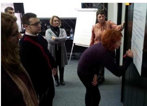
Práce ve skupinách na semináři v srbském Kragujevac, únor 2013.

Dva mladí profesionálové z Kosova pracující v tamních NNO byli podpořeni v rámci projektu Visegrad-Balkan Public Policy Fund: Young Researchers Programme , z podpory Mezinárodní-