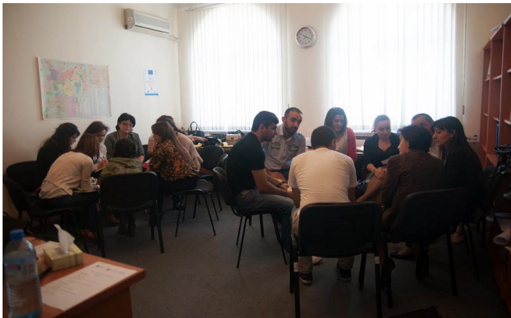
Práce ve skupinách během semináře v Jerevanu, květen 2013.

The Steering Committee of the EU-Russia Civil Society Forum has issued a statement protesting the growing persecution of independent civil society organisations in Russia as a result of repressive legislation on “foreign agents”. The Forum cites the convictions meted out on two of its member organisations, the GOLLOS Association and its regional partner, as well as the Kostroma Support Center for Civic Initiatives . The fourth NGO convicted as a “foreign agent” is the St Petersburg LGBT film festival, Side by Side . In all, the authorities have taken action against more than 40 NGOs, many of them members of the Forum.