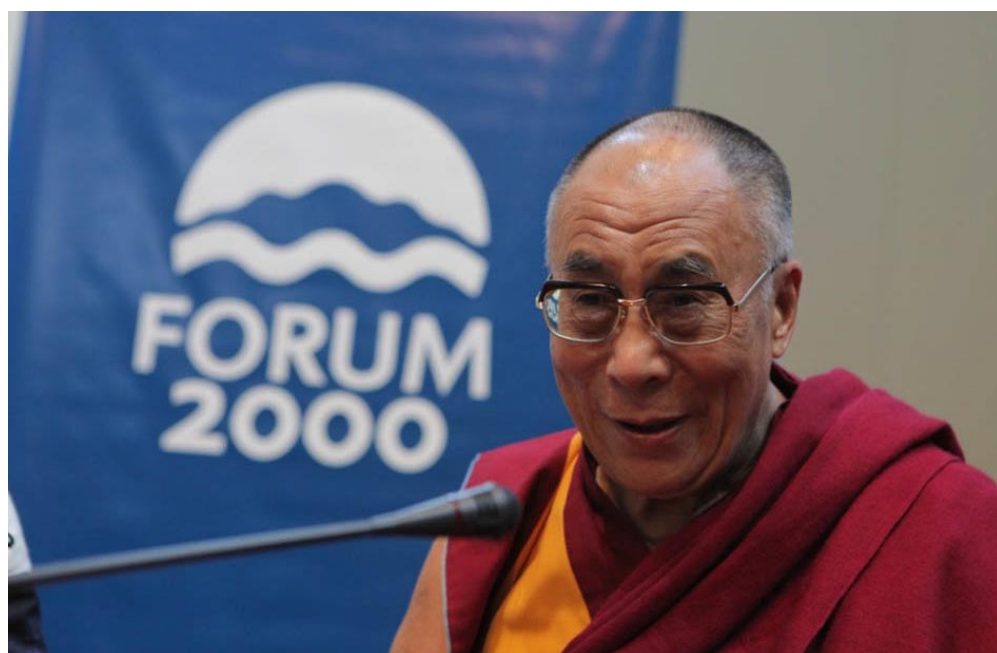
17. září se uskuteční přednáška Jeho Svatosti dalajlamy v O2 areně.

Hlavním tématem letošní konference budou různé aspekty společenských transformací po celém světě, jejich problémy, důsledky a budoucí perspektivy. Konference pokračuje v rozvíjení odkazu zakladatele Nadace Forum 2000 Václava Havla. Předběžný program naleznete na stránkách Nadace Forum 2000. Hlavní část konference bude opět vysílána v přímém přenosu.