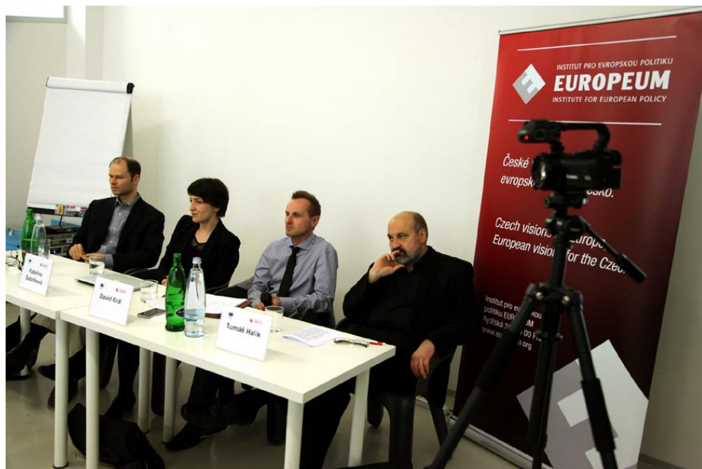
Účastníci panelové diskuse o budoucnosti Evropy.

Výběr 13 dokumentů z letošního programu Mezinárodního festivalu dokumentárních filmů o lidských právech Jeden svět se od 21. do 29. května promítal bruselskému publiku. Jeden svět v Bruselu zahájil Stavros Lambrinidis, zvláštní představitel EU pro lidská práva, a Martin Povejšil, velvyslanec ČR při Evropské unii. Přehlídku filmů otevřel snímek Úžasný Ázerbájdžán . Jeho projekce se účastnil také právník a aktivista Intigam Alijev a investigativní novinářka Chadidža Ismailová, čelné osobnosti boje za dodržování lidských práv v Ázerbájdžánu.