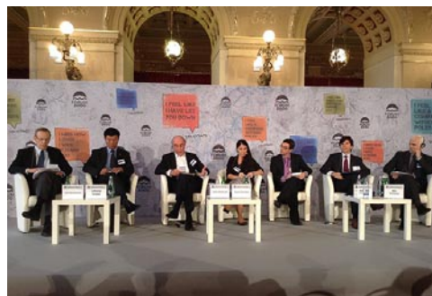
Mezinárodní konference Forum 2000.

Zakladatel a předseda Centra pro lidská práva Vjasna vystoupil v pondělí 13. 10. na dvou panelech: přímo na Žofíně diskutoval o hodnotách zahraniční politiky Václava Havla na panelu nazvaném „The significance of Václav Havel's value based foreign policy“. Věžňům svědomí a porušování lidských práv se věnoval odpoledne v Evropském domě v rámci panelu „Prisoners of conscience: resistance against human rights abuses, across contexts and generations“, který organizovalo Občanské Bělorusko společně s Amnesty International.