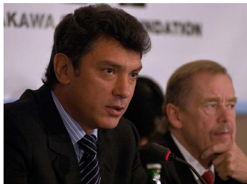
Boris Němcov a Václav Havel na konferenci Nadace Forum 2000 v roce 2005.

Jako delegát se zúčastnil konferencí Nadace Forum 2000 v roce 2005 a 2011. Nijak se netajil kritikou ruské pozice v ozbrojeném konfliktu na východě Ukrajiny. Boris Němcov, ruský opoziční politik a aktivista, byl zavražděn 27. února 2015.